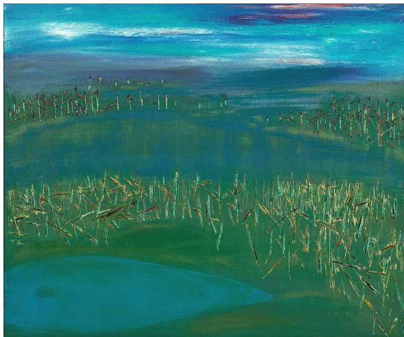
(J'ai pour nous deux lacs. R.Duguay 2005 acryliques sur toile)

« J'entend le cri de l'eau, celui de l'air, et celui de la planète » -R.Duguay