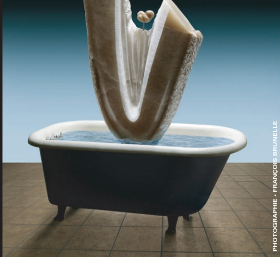
GRAINE DE VIE • LISE DESCHÂTELETS